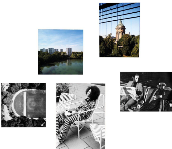
Abb. 03 Christian Borth, Bilderwolke aus Mannheim Connected, 2019, Foto: © Christian Borth (Prince House Gallery)