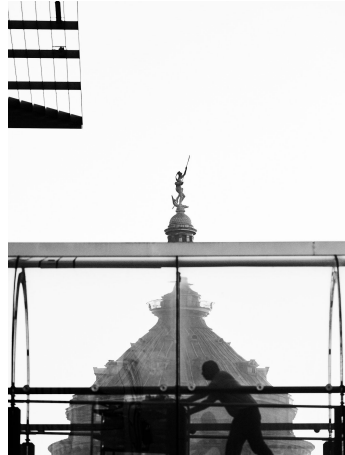
Abb. 01 und 02 Christian Borth, aus Mannheim Connected, 2019